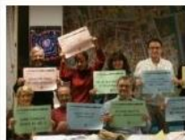
Focus Misto2 11 ottobre