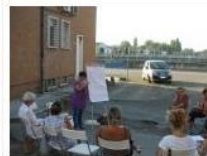
Focus Donne 2