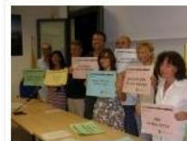
Primo focus residenti