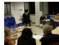
Secondo gruppo residenti