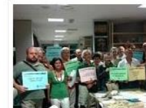
Focus comitati promotori