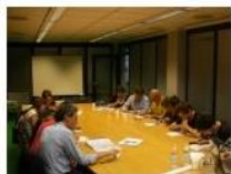
Focus scuola superiore di studi sulla città e il territorio, università di Bologna.