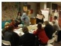
Focus Misto 11 ottobre